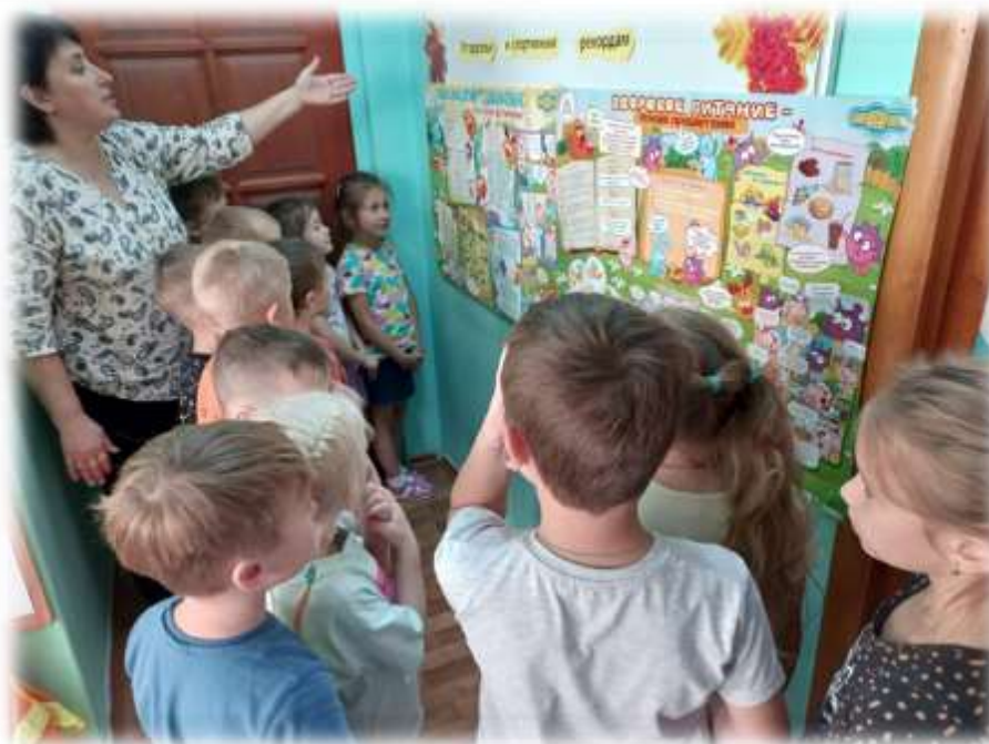
Беседа «Что нужно для крепкого здоровья?»